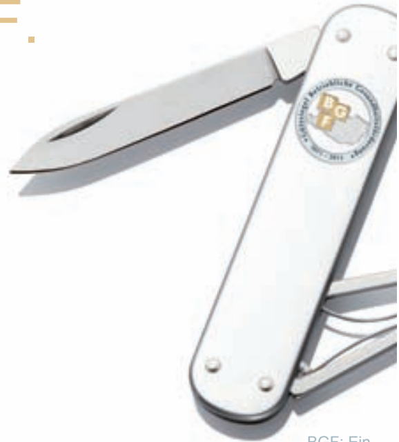
BGF: Ein scharfer Schnitt bei Ihren Kosten.