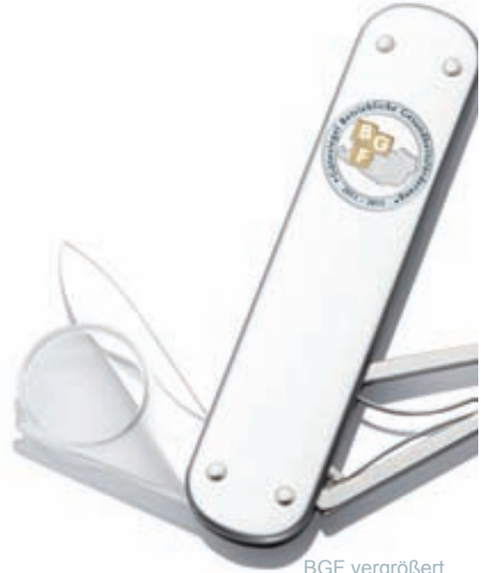
BGF vergrößert auch Ihr Image.