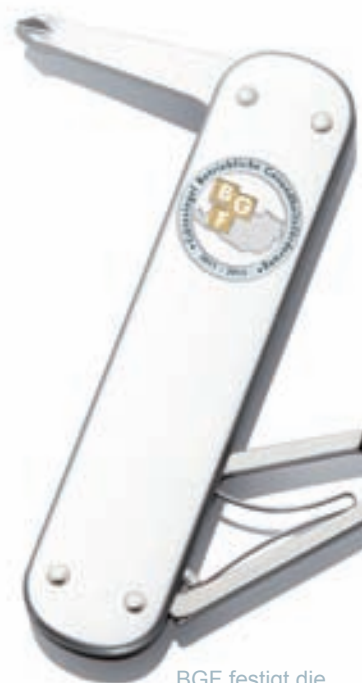
BGF festigt die Bindung aller zum Betrieb.

Ganz bewusst bindet das BGF-Programm alle MitarbeiterInnen ein. Jede/r soll Vorschläge und Ideen für eine bessere Gesundheit einbringen. Häufig kennen MitarbeiterInnen die Problemstellen am besten. Damit die vorgeschlagenen Ideen in einem sinnvollen Rahmen bleiben (keine „Wunschkonzerte“), begleitet Ihr BGF-Betreuer das Projekt. So werden ausschließlich zielführende Maßnahmen gewählt.