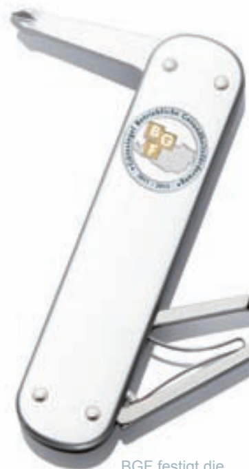
BGF festigt die Bindung aller zum Betrieb.

Ganz bewusst bindet das BGF-Programm alle MitarbeiterInnen ein. Jede/r soll Vorschläge und Ideen für eine bessere Gesundheit einbringen. Häufig kennen MitarbeiterInnen die Problemstellen am besten. Damit die vorgeschlagenen Ideen in einem sinnvollen Rahmen bleiben (keine „Wunschkonzerte“), begleitet Ihr BGF-Betreuer das Projekt. So werden ausschließlich zielführende Maßnahmen gewählt.